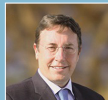
ACHIM STEINER directeur général du Programme des Nations unies pour l'environnement (PNUE)