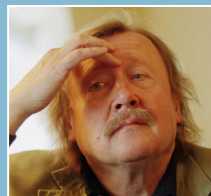
PROF. DR. PETER SLOTERDIJK philosophe et écrivain