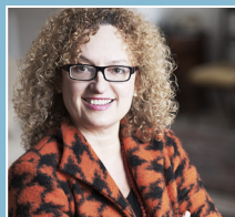
CAROLYN CHRISTOV-BAKARGIEV directrice artistique de la documenta13, Kassel