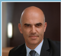
ALAIN BERSET conseiller fédéral et ministre de la Culture

LAISSÉZ-VOUS INSPIRER AU 8 E CONGRÈS NATURE PAR LES CONFÉRENCES DE: