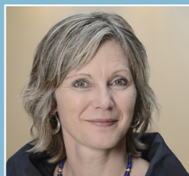
MAYA GRAF présidente du Conseil national