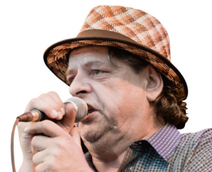
Endo Anaconda www.stillerhas.ch